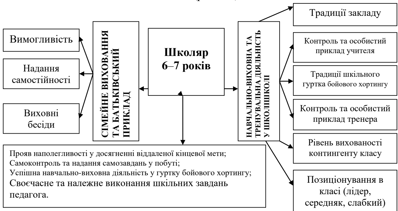
Рис. 2.2. Чинники реалізації педагогічних умов виховання наполегливості у школярів віком 6–7 років

самовиявлення наполегливості: прояв наполегливості у досягненні віддаленої кінцевої мети, самоконтроль та надання самозавдань у побуті, успішна навчально-виховна діяльність у гуртку бойового хортингу, своєчасне та належне виконання шкільних завдань (рис. 2.2).